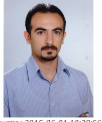
Oluşturma : 2015-06-01 10:38:56 Düzenleme : 2019-06-13 00:36:54